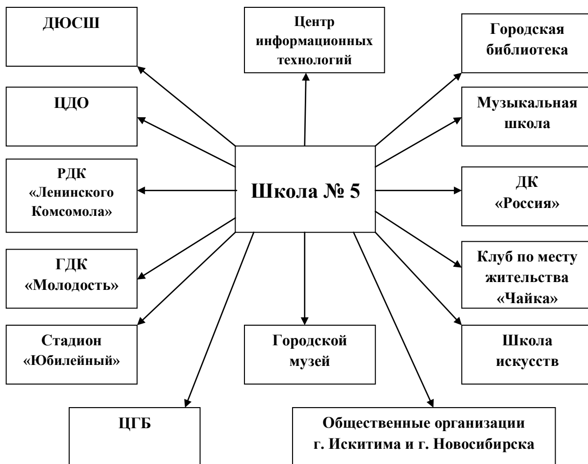
Схема взаимодействия школы с учреждениями города